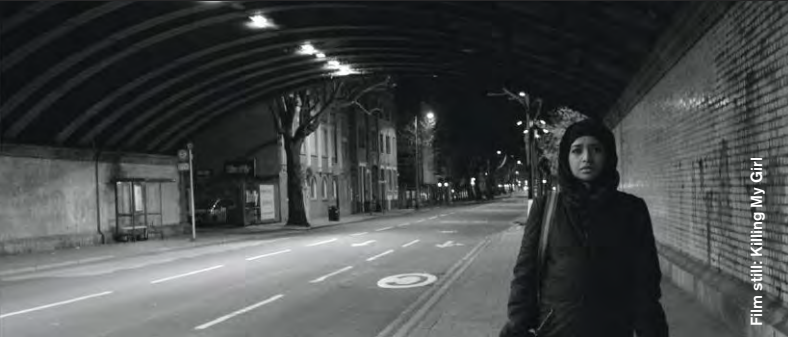
Film still: Killing My Girl

Drama / Comedy / Animation / Musical / Music Video / Science Fiction