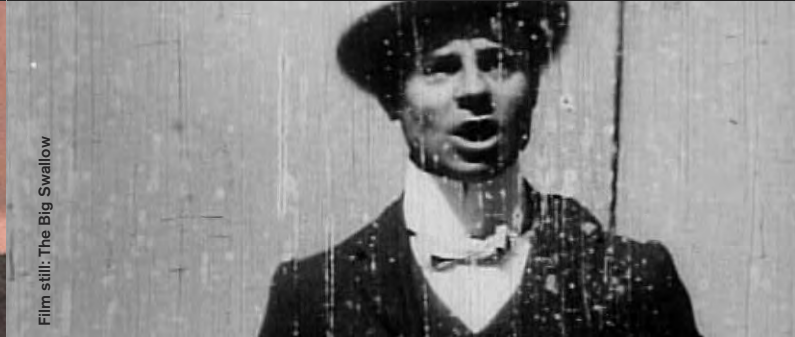
Film still: The Big Swallow

Silent Short Films (1895–1910) / Music: Dirk Markham / Duration: approx. 60min