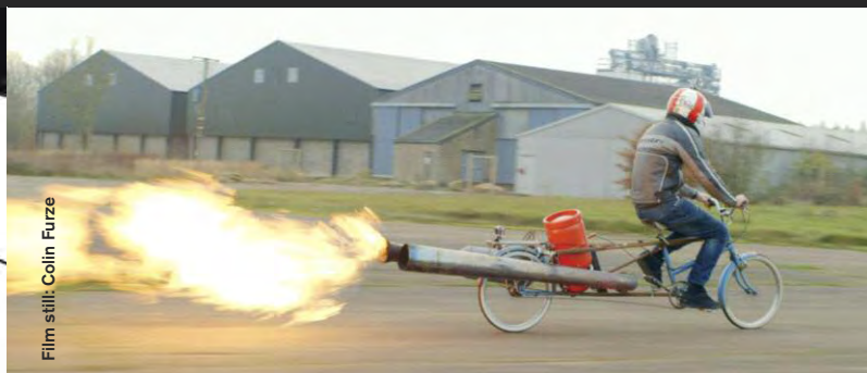
Film still: Colin Furze