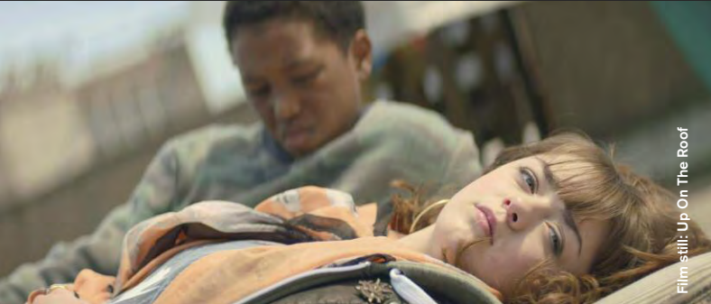
Film still: Up On The Roof

Comedy / Drama / Animation / Experimental