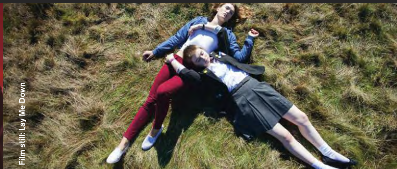
Film still: Lay Me Down

Lay Me Down (Drama), R: Lucy Tcherniak, 11:00 Eine merkwürde Beziehung: Zwei Mädchen fühlen sich durch ein dunkles Geheimnis verbunden. A curious relationship between two girls and the dark secret that binds them.