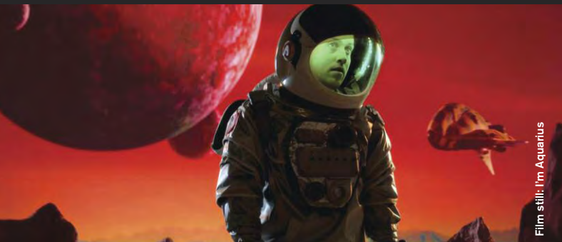
Film still: I'm Aquarius

Drama / Comedy / Animation / Science Fiction / Music Video