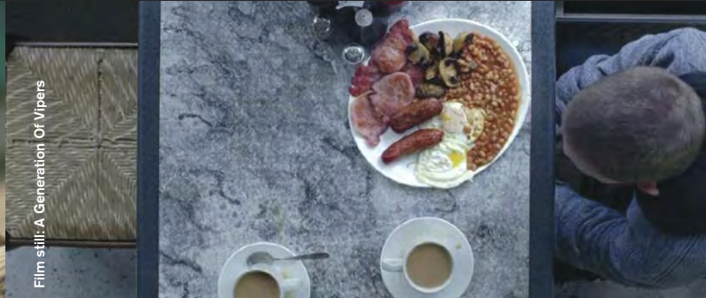
Film still: A Generation Of Vipers

Russian Roulette (Comedy), R: Ben Aston, 5:00 London erscheint ein bisschen weniger einsam, als Lucy im Chatroulette einen Kosmonauten trifft. London seems a little less lonely when Lucy meets a cosmonaut on Chatroulette.