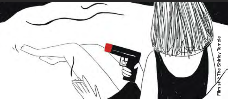
Film still: The Shirley Temple

Animation / Experimental / Music Video / Drama