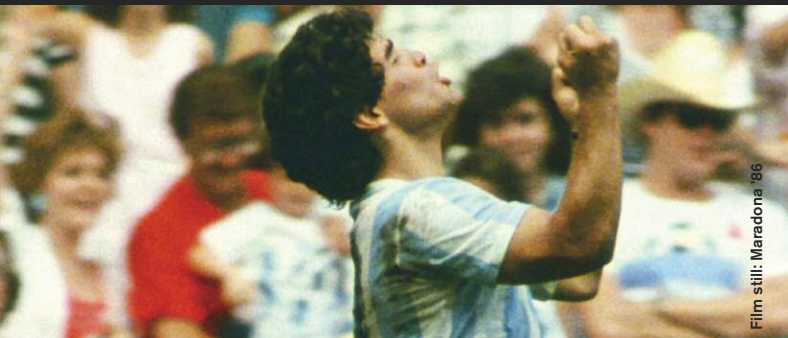
Film still: Maradona '86