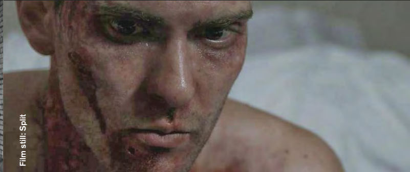
Film still: Split

Horror / Thriller / Black Comedy / Animation / Fantasy / Science Fiction