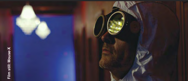
Film still: Mouse-X

Thriller / Drama / Animation / Comedy / Science Fiction